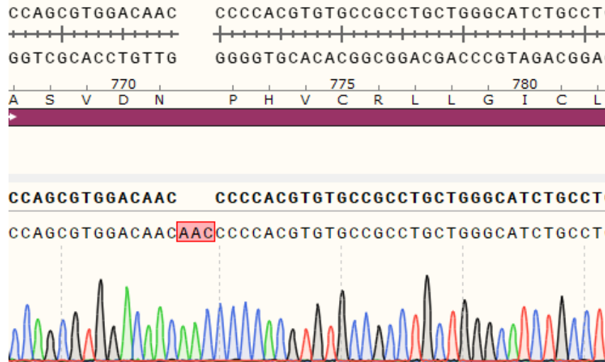
Fig 3. H_EGFR(N771-P772insN) BAF3 Cell Line 测序结果